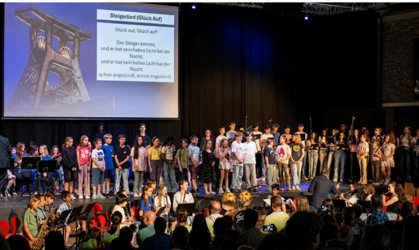
Sommerfest 2026