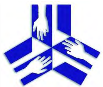
Unser Dank an den Förderverein!

Die zweite Veränderung betrifft die Pausenhalle des Neubaus. Mitte nächster Woche wird dort die so genannte „Lerninsel“ entstehen, von der vor Wochen bereits im Newsletter die Rede war und die auf eine Anregung der Arbeitsgruppe Stoppenberg 2020 und schließlich auf einen Beschluss der Mitwirkungsgremien in Absprache mit der Tagesheimleitung geplant und angeschafft worden ist. Die